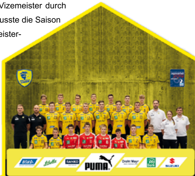
B-Jugend Meisterschaft BWOL

Ähnlich ausgebremst wurde auch die U15. Der Badische Meister, mit klaren 30:0 Punkten hatte die Konkurrenz das Nachsehen, durfte den Baden-Württemberg-Pokal in diesem Jahr nicht mehr verteidigen. Erfreulich war auch das Abschneiden der U16 als Meister der Landesliga.