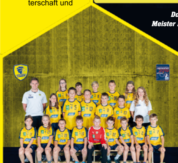
E-Jugend Meister Bezirksliga