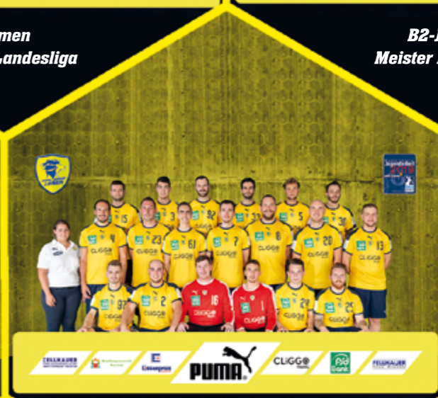
Herren III Meister Kreisliga

Im jüngeren Bereich schaffte die männliche E-Jugend die Meisterschaft in der Bezirksliga.