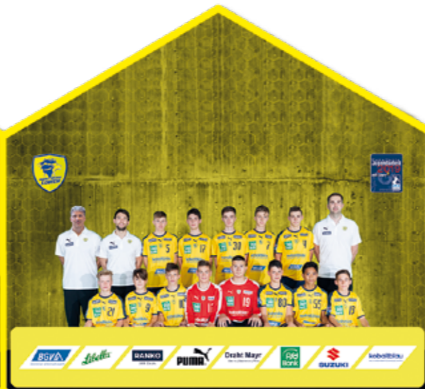
C-Jugend Badischer Meister