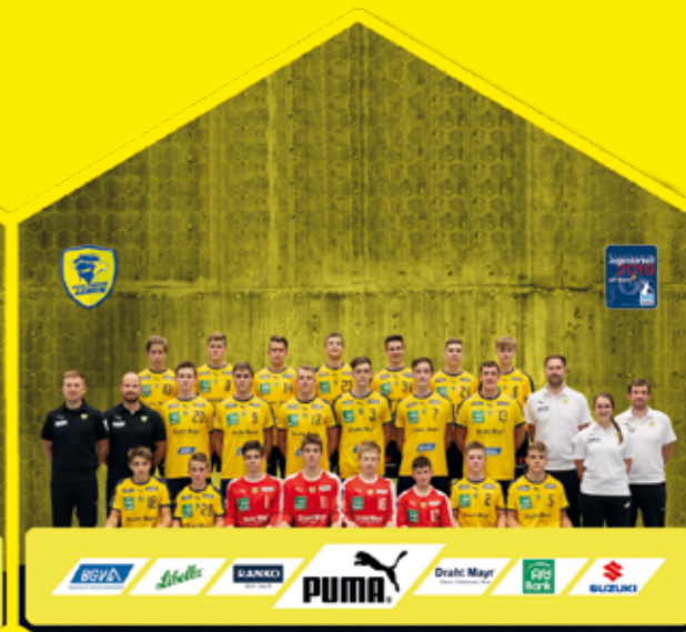
B2-Jugend Meister Landesliga