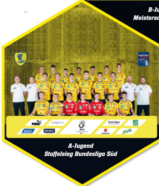
A-Jugend Staffelsieg Bundesliga Süd

gleichzeitig Aufstiege in die nächsthöhere Spielklasse.