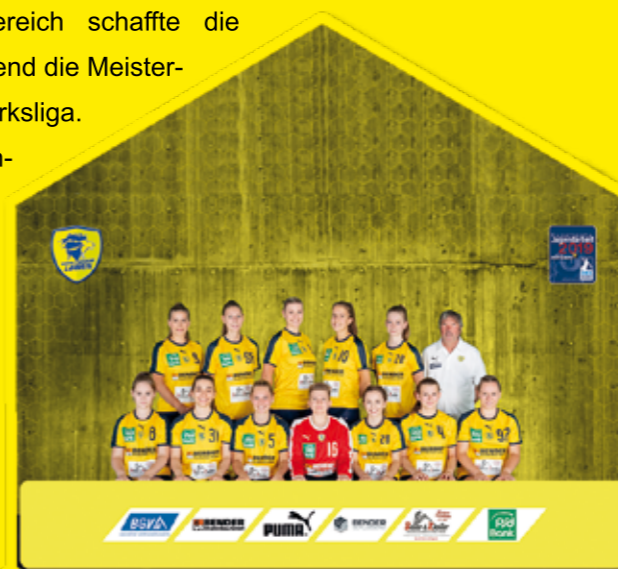
Damen Meister Landesliga

Auch im Seniorenbereich gab es Titelgewinne: Sowohl die Männer (in der Kreisliga) als auch die Frauen (in der Landesliga) feierten die Meisterschaft und